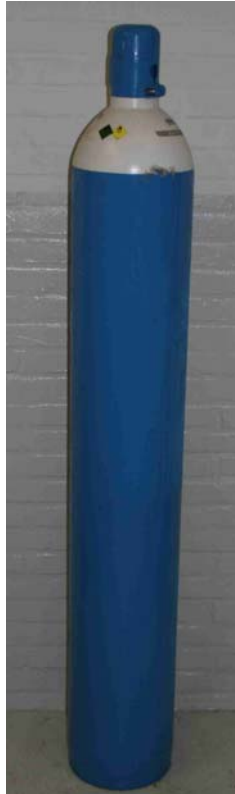
Afbeelding 18: gasfles