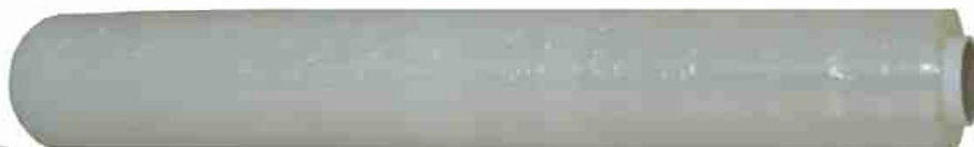
Afbeelding 20: kern

Kernen, spoelen en haspels zijn cilindervormig en worden gebruikt om het te verpakken product om te wikkelen. Kernen kunnen zowel massief zijn als hol. Kernen, spoelen en haspels kwalificeren bij een lengte vanaf 50 cm als een logistiek hulpmiddel. Afbeelding 20 en 21 zijn een voorbeeld van een kern en een haspel.