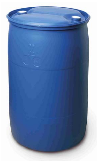
Afbeelding 16: kunststof vat