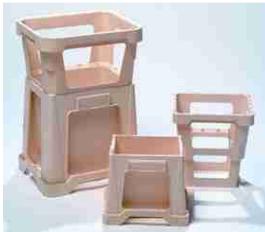
Afbeelding 5: kunststof krat