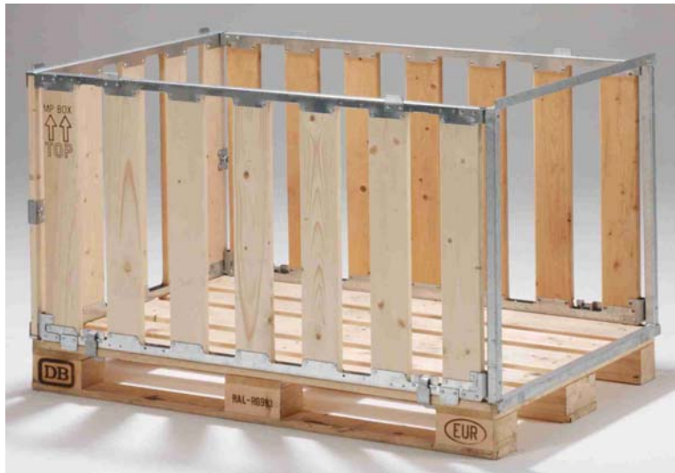
Afbeelding 9: palletbox

Worden de producten op de pallet bijeengehouden door kunststof folie dan kwalificeert deze folie niet als logistiek hulpmiddel. De producten die op pallets worden vervoerd worden soms gescheiden in laagjes waarvoor tussenplaten worden gebruikt. Deze tussenplaten worden aangemerkt als logistiek hulpmiddel als ze eenzelfde oppervlakte hebben als de pallet en bedoeld zijn om in combinatie met de pallet te worden gebruikt. Zie afbeelding 9 voor een voorbeeld van een tussenplaat.