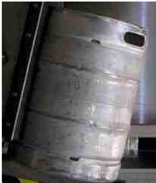
Afbeelding 15: biervat