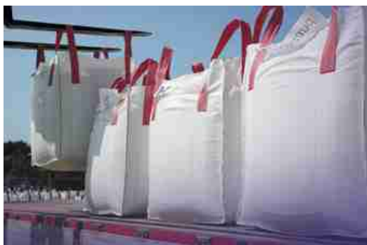
Afbeelding 19: Big bag