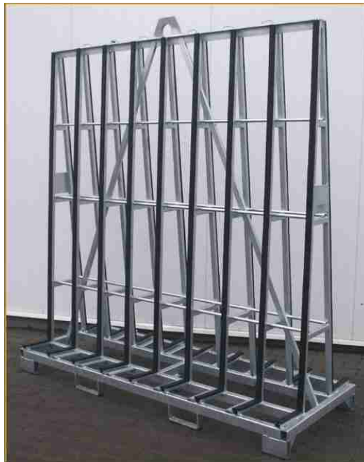
Afbeelding 11: glasbok

Glasbokken worden gebruikt voor het vervoeren van grote stukken glas, vaak bedoeld voor ramen. Afbeelding 11 geeft een voorbeeld van een glasbok.