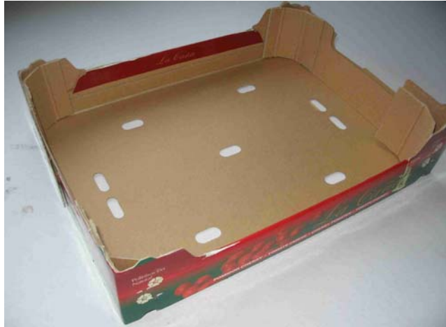
Afbeelding 3: kartonnen krat