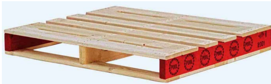
Afbeelding 7: pallet

Pallets worden veelal gebruikt om een grote hoeveelheid producten op een makkelijke wijze per vrachtwagen te vervoeren. Ze zijn zo gemaakt dat ze eenvoudig met een heftruck in en uit een vrachtwagen kunnen worden gehaald. Zie afbeelding 7 voor een voorbeeld van een pallet.