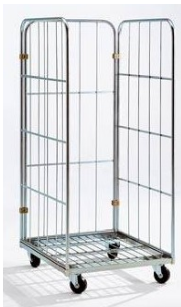
Afbeelding 13: rolcontainer

Rolcontainers zijn voorzien van wielen en in de regel van twee of meer (demontabele) opstaande rekken. Afbeelding 13 is een voorbeeld van een rolcontainer.