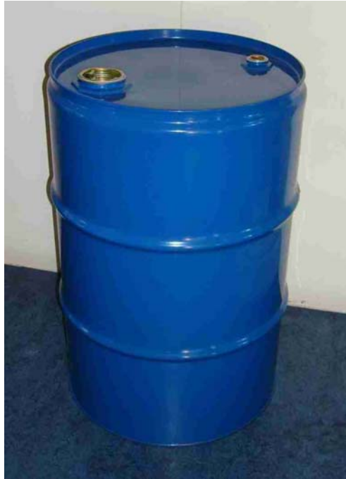
Afbeelding 14: olievat