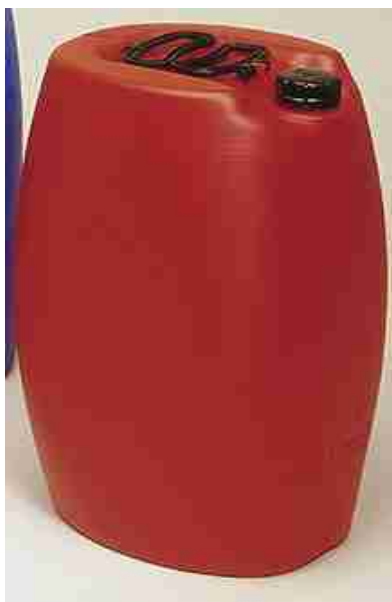
Afbeelding 17: jerrycan