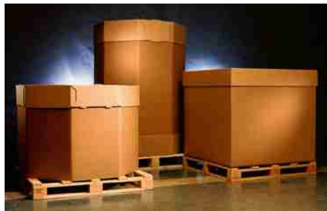
Afbeelding 2: kartonnen doos