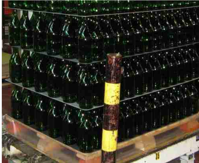
Afbeelding 10: tussenplaat