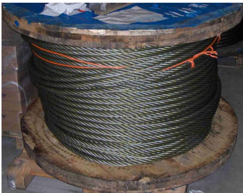
Afbeelding 21: haspel

In het tweede lid wordt bepaald dat voor zover de afbakening van de lijst van logistieke hulpmiddelen plaatsvindt aan de hand van de inhoudsmaat de inhoud dient te worden bepaald aan de hand van de binnenmaat. Hierdoor is het niet van belang hoe dik het materiaal van de verpakking is. Door uit te gaan van de binnenmaten wordt aangesloten bij de wijze waarop deze verpakkingen worden aangeboden. Hierbij zal in het algemeen worden aangegeven welke hoeveelheid in de verpakking kan worden verpakt.