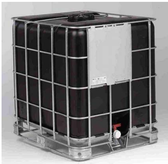
Afbeelding 12: IBC