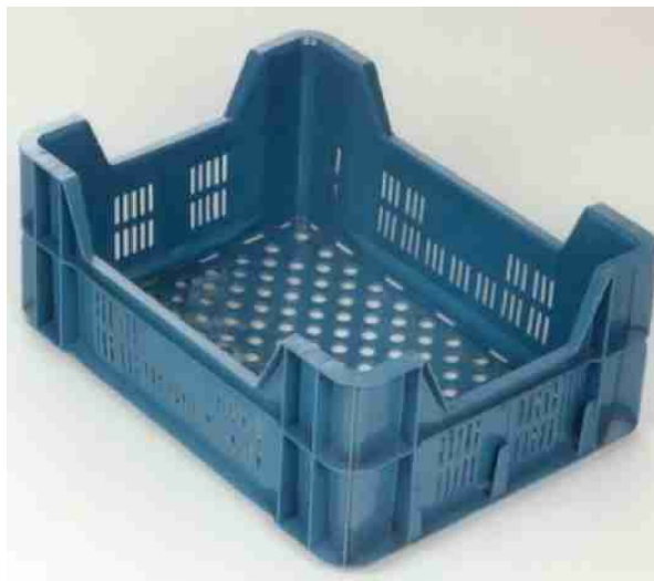
Afbeelding 4: kunststof krat