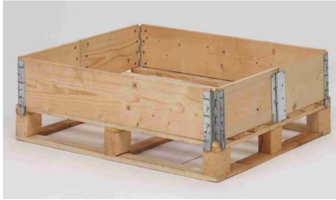
Afbeelding 8: opzetrand van een pallet